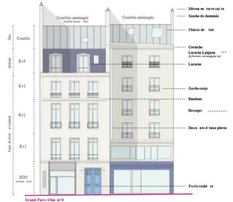
Façade du 5 rue de Cléry avant rénovation